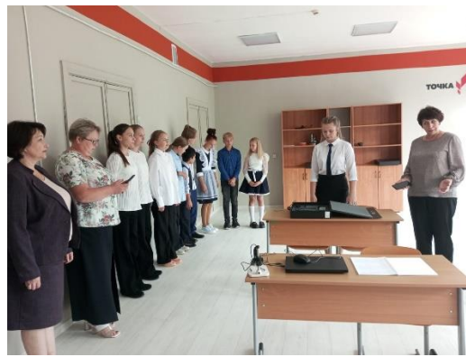
Работа с цифровой лабораторией центра «Точка роста» МОУ ШУШКОДОМСКОЙ СОШ

В рамках регионального проекта "Цифровая образовательная среда" НП «Образование» МОУ БАРАНОВСКОЙ СОШ обеспечена материально-технической базой для внедрения цифровой образовательной среды. В школу поступило современное цифровое оборудование для проведения уроков по физике, биологии, химии и технологии.