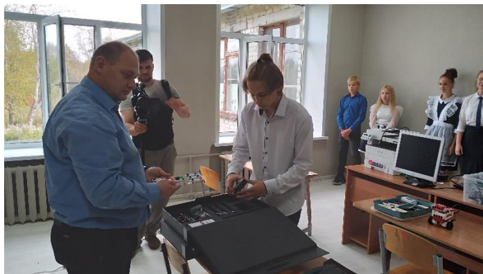
Открытие центра «Точка роста» МОУ ШУШКОДОМСКОЙ СОШ

В 2020 -2023 году в рамках регионального проекта "Современная школа" НП «Образование» были реализованы инфраструктурные мероприятия по созданию и обеспечению функционирования центров "Точка роста". Всего в Буйском муниципальном районе на базе школ создано 7 «Точек роста». В 2024 году создан центр образования естественнонаучной и технологической направленности «Точка роста» на базе МОУ ШУШКОДОМСКОЙ СОШ.